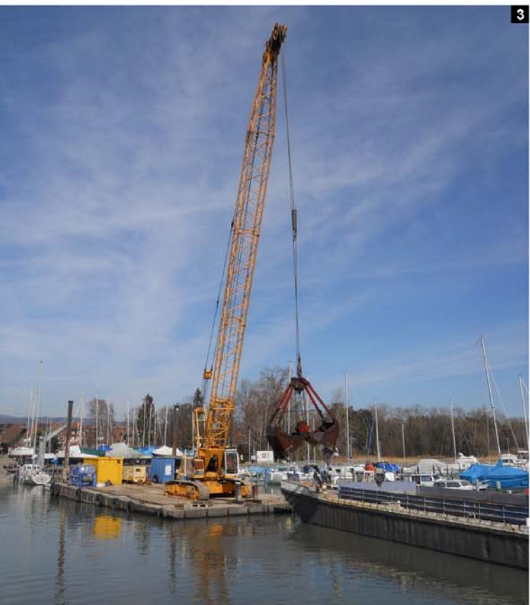
1.2.3. Dragage depuis ponton Flexy-float avec pelle à câble Liebherr 853 HD. Chargement et noyage des sédiments par chaland.